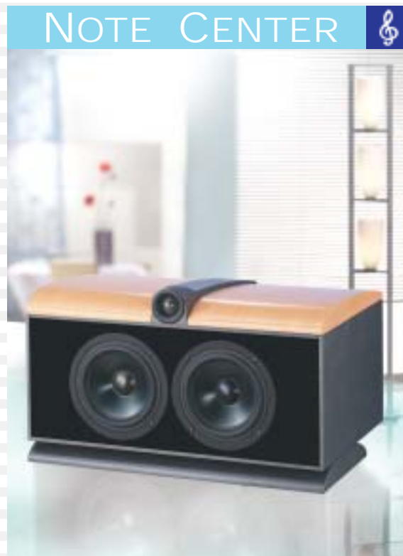
2- Wege System mit Passivmembran 2- way system with passive radiator

We use a ventilation-system enclosure in the bass range for the Note Series. In addition, there are oval passive radiators on the rear of the loudspeaker to increase the radiation surface area for the low frequencies. A special feature is the passive radiator that can be adjusted in weight so that the room acoustics can be taken into account and the bass characteristics can be tuned to suit the location.