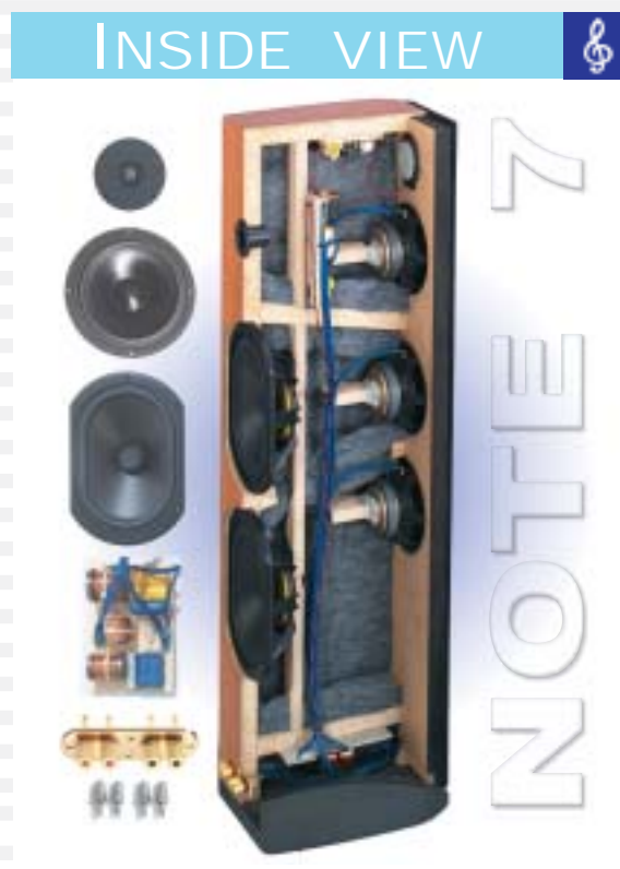
Abstimbare Passivmembran Adjustable passive radiator