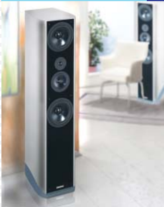
3- Wege System mit vier Passivmembranen

3- way system with four passive radiators