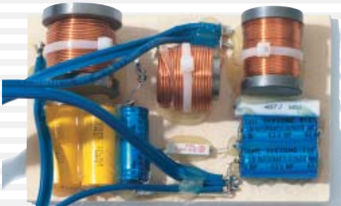
NOTE - CROSSOVER