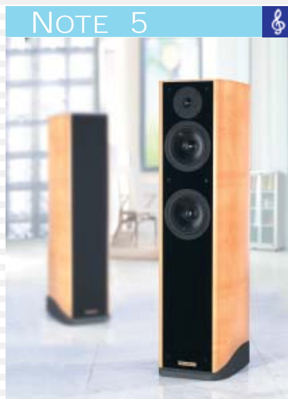
2.5- Wege System mit zwei Passivmembranen 2.5- way system with two passive radiators