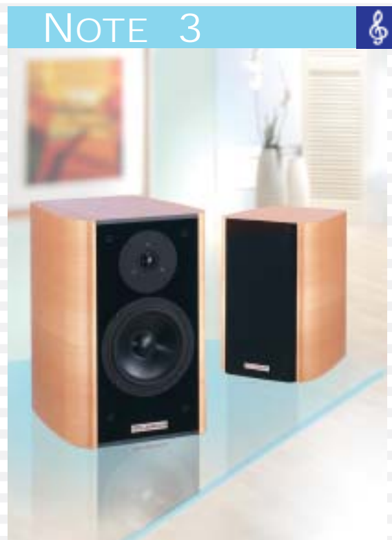
2- Wege System mit Passivmembran 2- way system with passive radiator

In the development of this superb sound speaker, special audio frequency measuring equipment was used to compare its performance against the reference model. It gives the listener a sound experience that is in a class of its own. Not shy to tackle the full range of musical choice, the Note 5 will complement any high-end audio components. Naturally, our Entry M can be used as a surround speaker in a home cinema set up with the Note 5 as the front system.