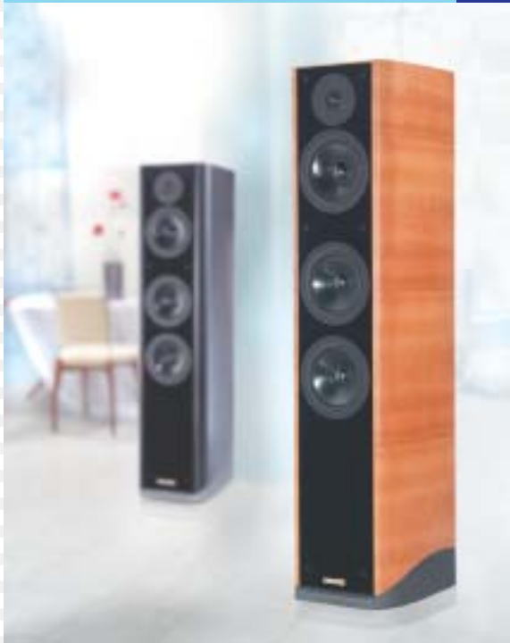
3- Wege System mit zwei Passivmembranen

3- way system with two passive radiators