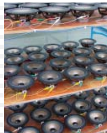
BURN IN TEST

To find approval from the audio reviewers is an achievement in itself, but when our customers nominated us as product winners in consumer choice categories our convictions were further justified. ALR JORDAN loudspeakers are now available in most countries in the world and the reaction from retailers, consumers and the press has been the same. Whatever your choice, all the Entry Series models reproduce with finesse. It is a product of excellence in both quality and value for money.