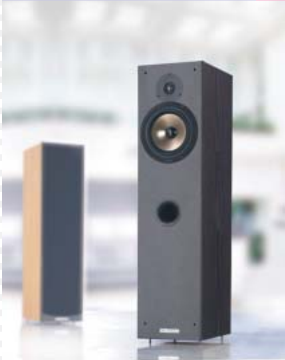
2-Wege Bass Reflex System