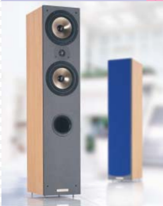
2-Wege Bass Reflex System