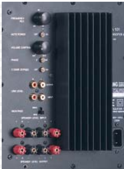
SUB - MODULE

The philosophy of our company is simple: it is to produce the finest products; material selection; production processes; attention to detail and inspection all reflect this. Technology and tradition are in balance; decisions are made to optimise the performance not the words in the brochure. All loudspeakers are handmade in Germany.