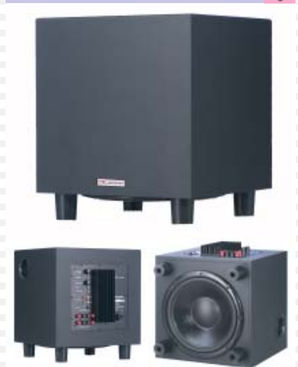
Aktives Basslautsprecher System