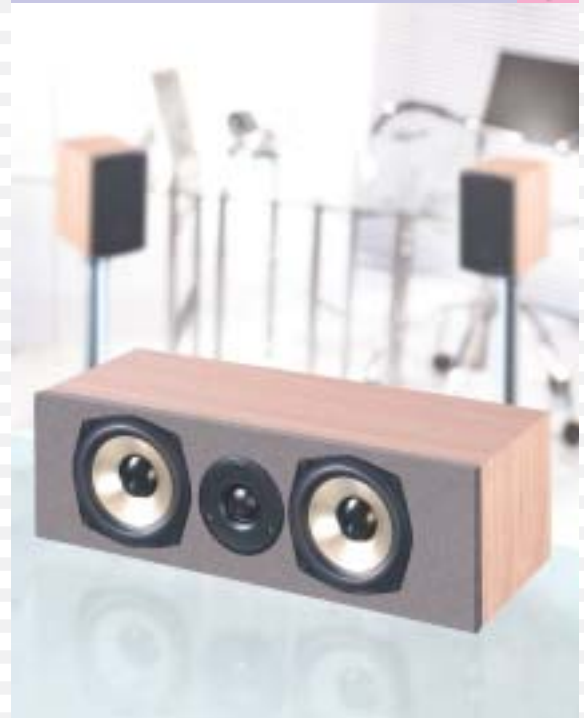
2-Wege Bass Reflex System